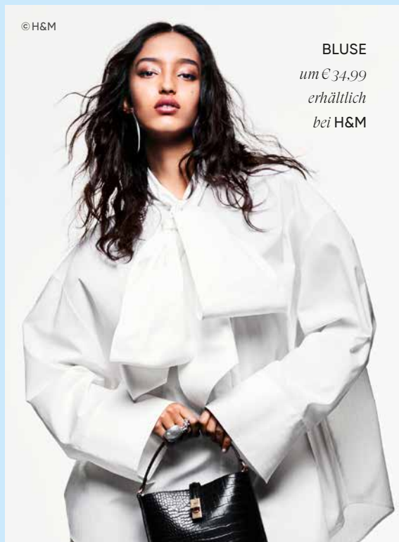
© H&M BLUSE um € 34,99 erhältlich bei H&M