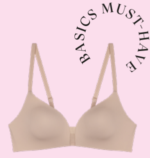
BH in Nude, um €55,- erhältlich bei Triumph

WUSSTEST DU, DASS SEHR VIELE FRAUEN DIE FALSCHER BH-GRÖSSE TRAGEN?